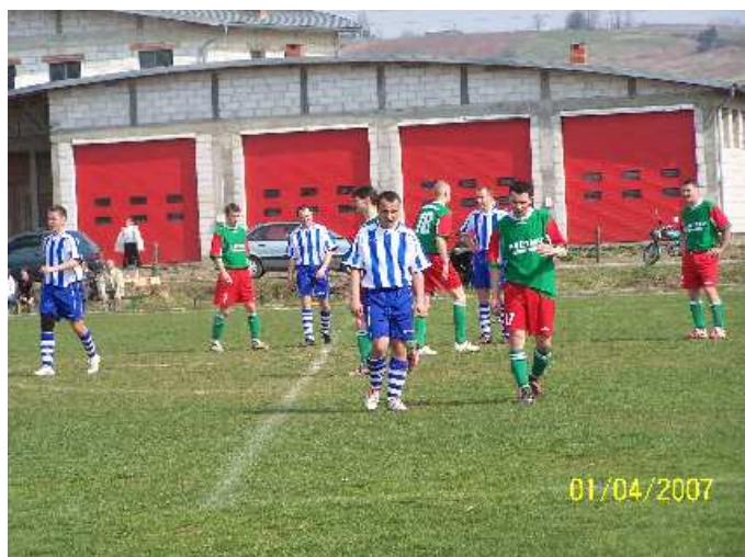
Skołyszyn - Czeluśnica